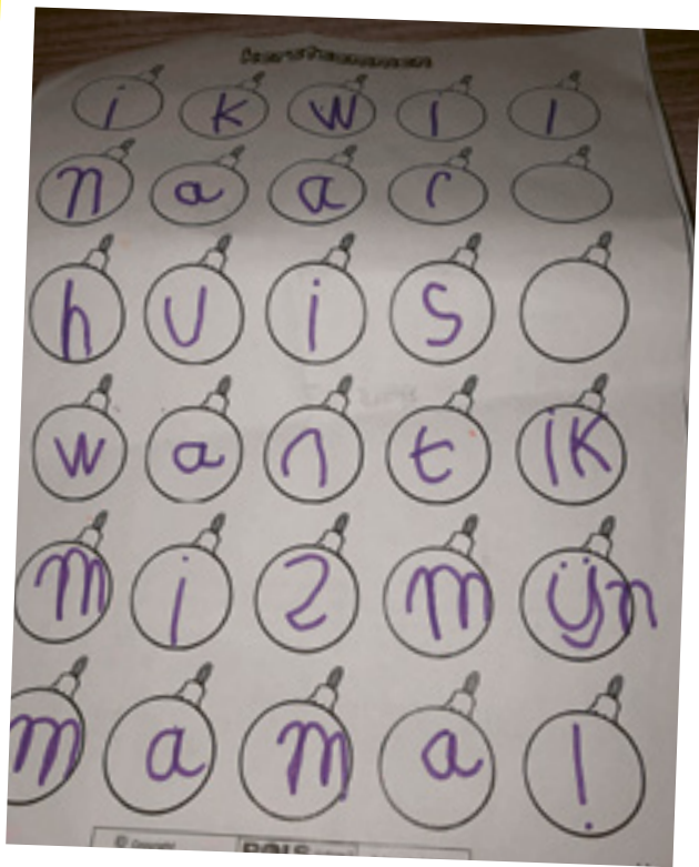
Nikki uit groep 4 heeft deze 'kerstsommen' op geheel eigen wijze opgelost.