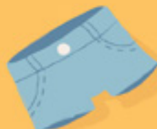
de korte broek