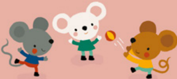
Grijze Muis, Kleine Muis en Snelle Muis