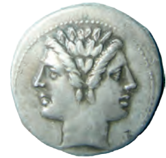
De twee gezichten van de Romeinse god Janus.

► Dubbeltalent, Fantastiek, Januaraanse Ambassade, Koninkrijk der Kosmopolieten, Linkshandig, Sauriërs