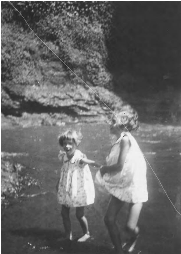
Tijdens de vakantie in de bergen in Sitoe Goenoeng, 1937.

verdiepingen. Iedereen had een tuin. In de onze stonden bomen waarin je kon klimmen. Mijn zusjes en ik gingen naar de Nassauschool aan de Besoekiweg. Het was dezelfde school als waar Barack Obama later naartoe ging. Zou hij op de fiets naar huis ook met zijn handen van het stuur de berg zijn afgeroetsjt? Ik zat in een leuke klas, af en toe voerden we toneelstukjes op. We maakten schoolreisjes naar een eilandje in de baai en naar de botanische tuin in Buitenzorg. Daar waren veel soorten planten en bomen. In de rivier zaten kleine slangen. Met onze neuzen boven het water keken we hoe zo'n slang een kikker opvrat.