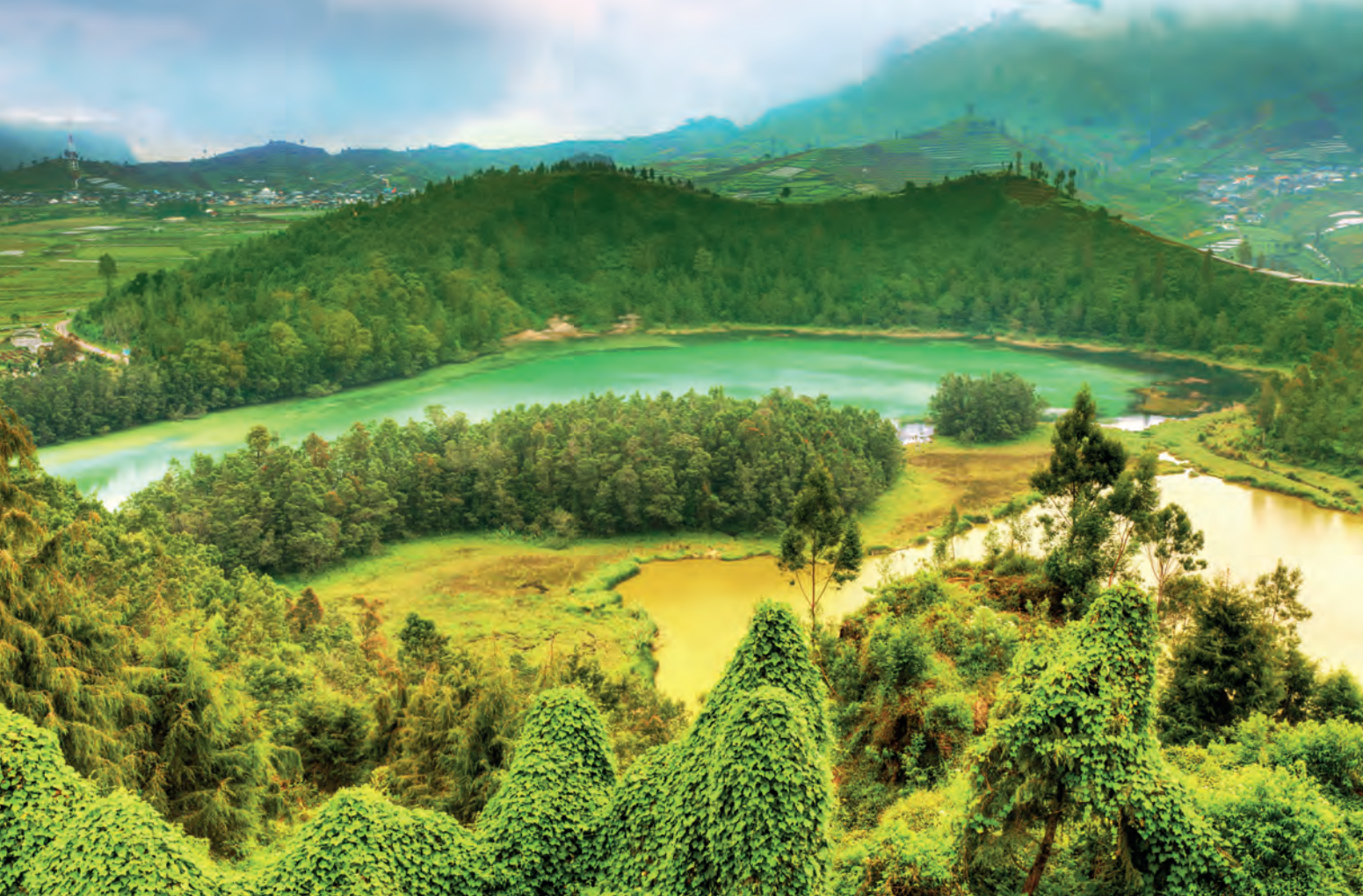
Het bergmeertje Telaga Warna.