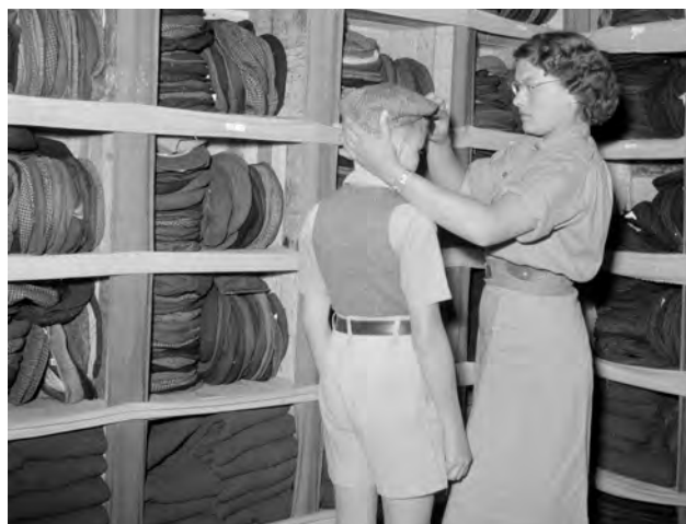
BOVEN De aankomst van De Tegelberg in Tandjong Priok, februari 1946. MIDDEN Repatrianten verlaten De Tegelberg in Ataka, april 1946. ONDER Petten passen in Ataka.