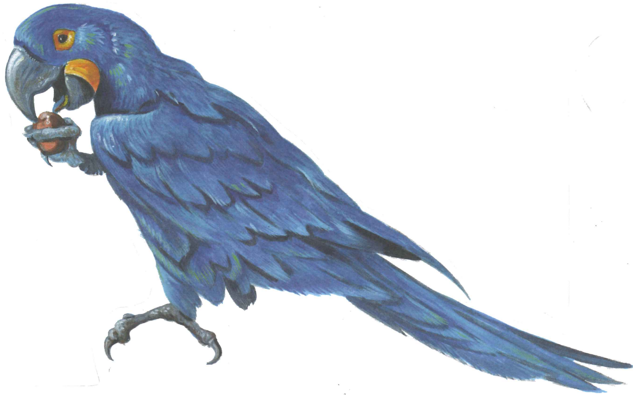
Hyacinthara's kunnen met hun sterke snavel makkelijk noten kraken.