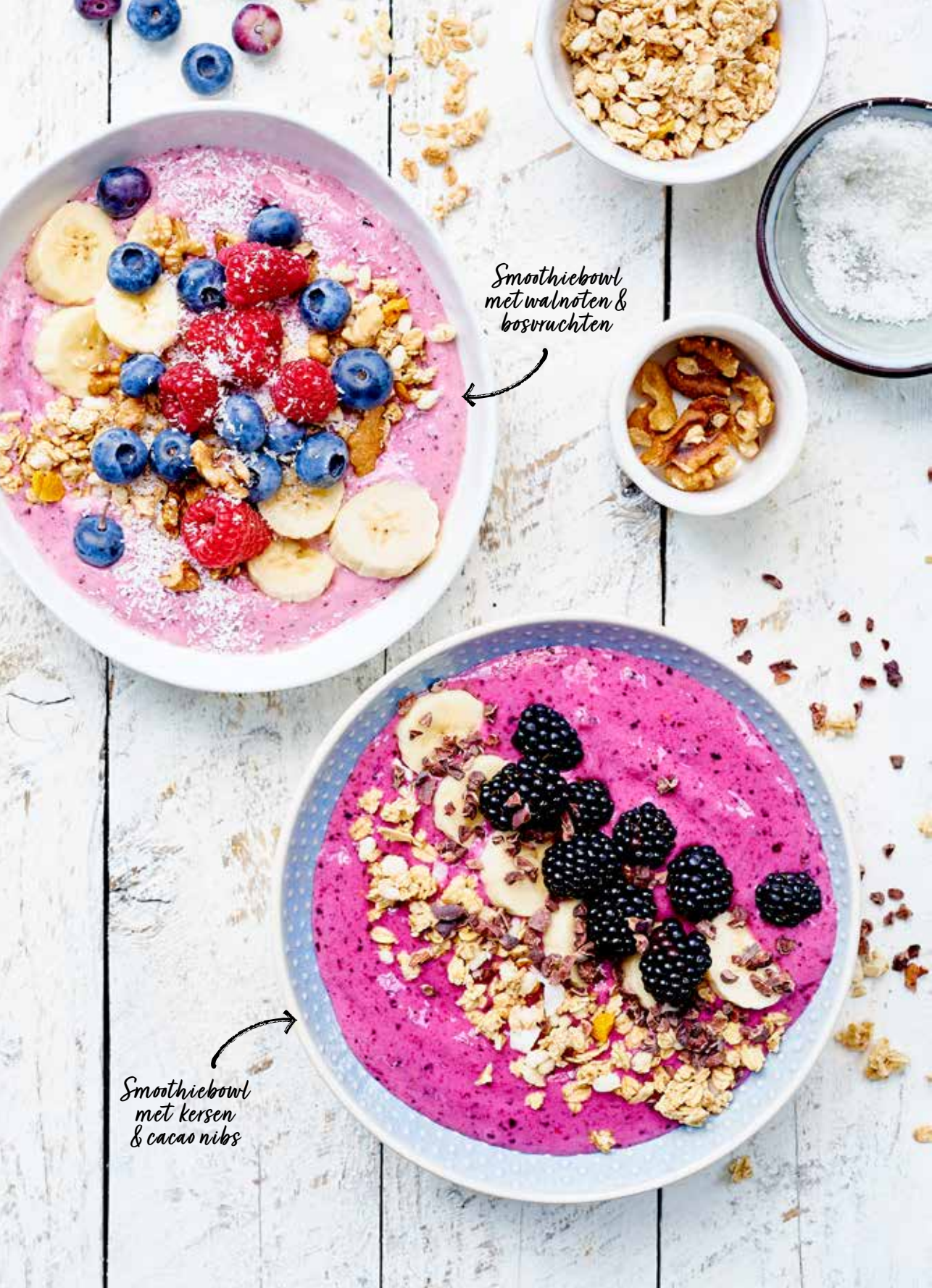
Smoothiebowl met walnoten & bosvruchten