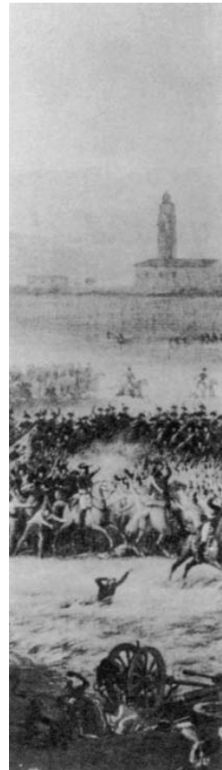
als een ondergaande.